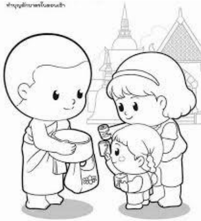
ทำบุญอุทิศบาปในเขตอินเดีย